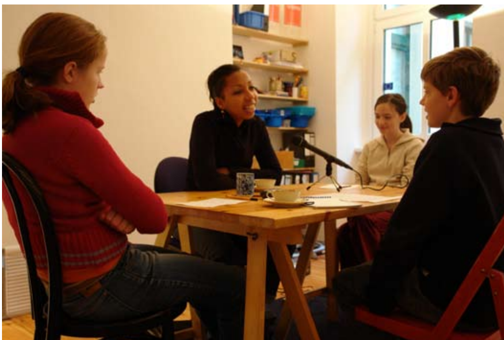
Marie NDiaye erzählt über ihren Schreibversuch mit 11 Jahren