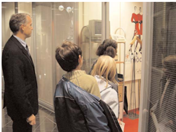
UN COUP D'ŒIL DANS LES BUREAUX